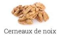
Cerneaux de noix

DESRIPTIF : FRUISEC est un fournisseur européen référent sur les ingrédients des industries alimentaires, principalement à base de fruits à coques. Le projet consiste à créer un nouvel atelier de conditionnement et des zones de stockage.